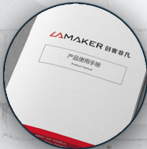
Binding and Folding